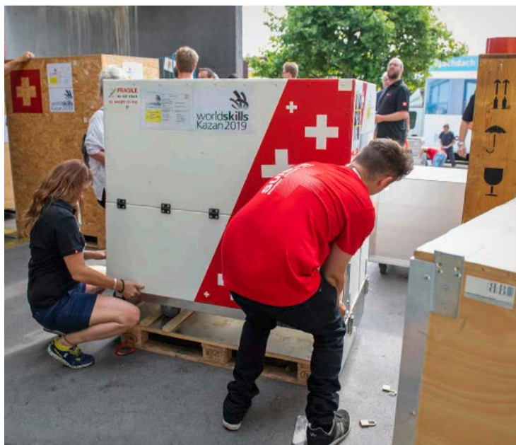
Fast zehn Tonnen Ware sind für die Berufsnationalmannschaft unterwegs.

Mehr Informationen unter: www.transgourmet.ch/gusto