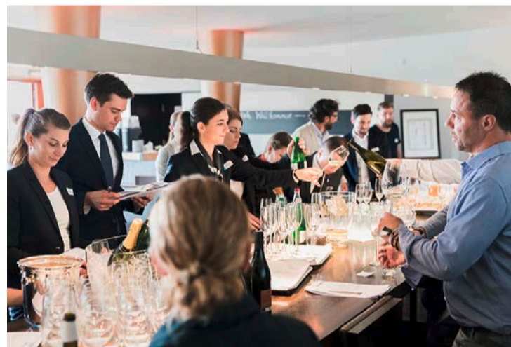
Beim Briefing wurden die verschiedenen Weine für das Menü vorgestellt.

Medial begleitet werden die Schweizer Berufsmeisterschaften unter anderem im Rahmen einer SRG-Themenwoche. Höhepunkt der umfassenden Berichterstattung ist eine neunstündige Live-Sendung auf SRF 1 am Samstag, 15. September. Vor Ort werden rund 150 000 Besucherinnen und Besucher erwartet. (AHU)