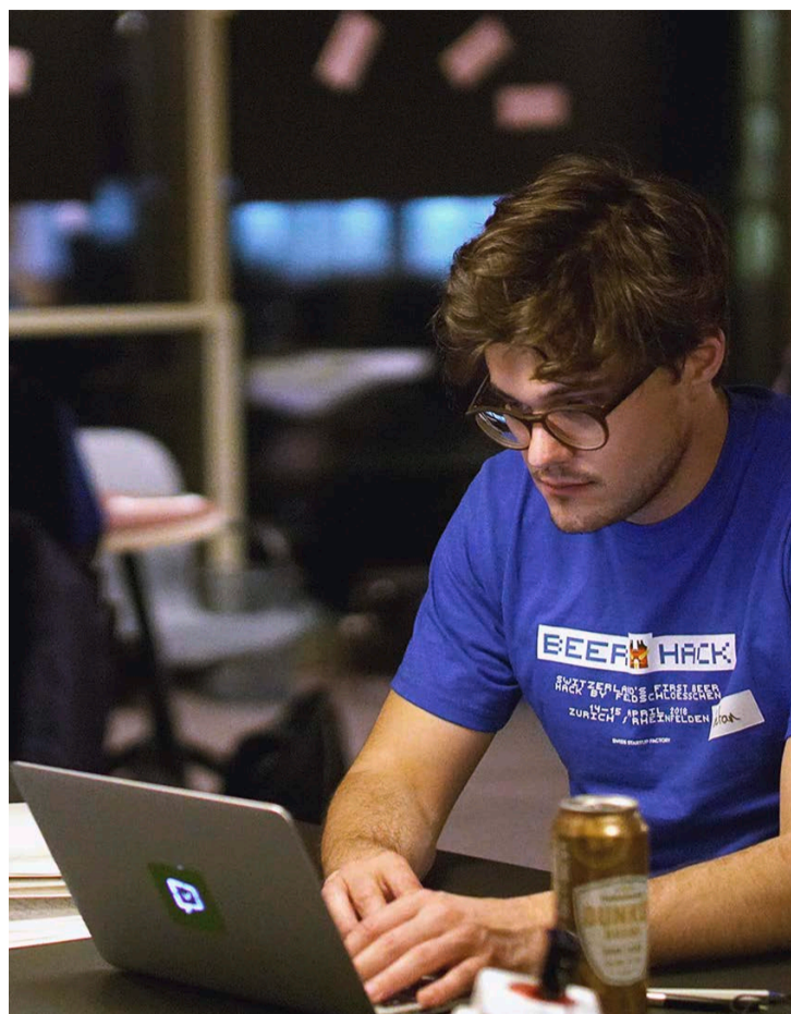
Neun Teams arbeiteten zwei Tage und eine Nacht lang an ihren Konzepten. Die Gewinner gründen nun ihre eigenen Start-ups.

Sie entwickeln eine App, die im Hintergrund blockchain-basiert ist – eine Technologie, die Daten zentral abgleicht und Empfehlungen abgibt. Szenario: Der Kunde kauft eine Kiste Bier und erhält auf sein Smartphone einen «To-